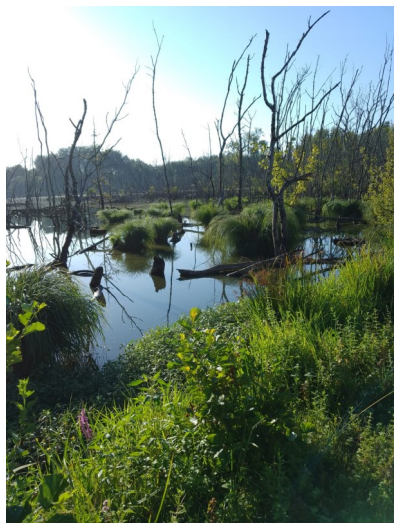
d'Europe, est impactée par les AFSB.

Le préfet de la région Nouvelle Aquitaine a signé l'autorisation environnementale